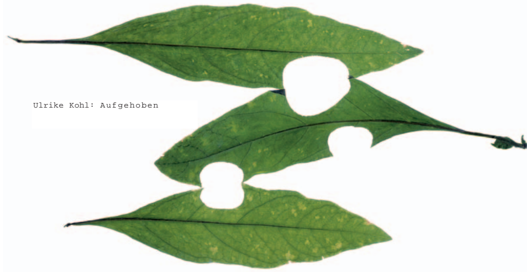
Ulrike Kohl: Aufgehoben

Ulrike Kohl sammelt Fundstücke, die sie im Studio präzise analog fotografiert, scannt, digital in Farbe und Maßstab bearbeitet und zu neuen Arrangements sortiert. So schafft sie eine eigene Realität. Die Fundstücke selbst werden wieder aufgegeben. Was bleibt, ist die Abbildung.