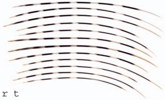
Ulrike Kohl: Aufgehoben